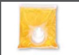
■ ■ Recharge gel Lave-main