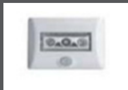
■ ■ Capteur de mouvement