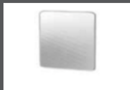
■ ■ Miroir