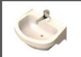
■ ■ Évier