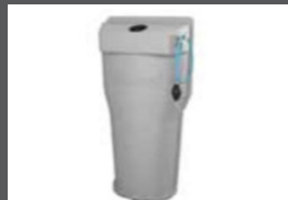
■ ■ Kit douchette à eau