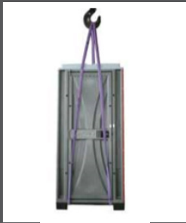
■ ■ Kit de levage

Une gamme d'accessoires vous permettra d'améliorer le confort de votre CabinModular.