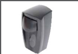
■ ■ Distributeur de gel lave-main