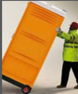
■ ■ Chariot de transport