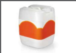
■ ■ Solution sanitaire Quantité : 19L