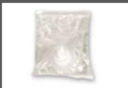
■ ■ Recharge gel antibactérien